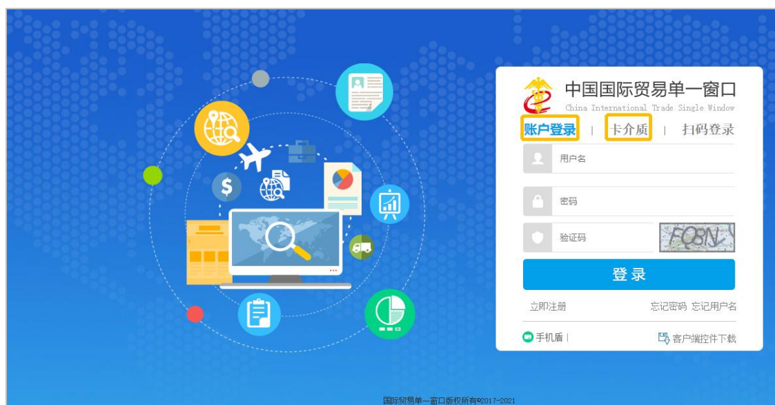
图 “单一窗口”标准版登录界面

在图“单一窗口”标准版登录界面中输入已注册成功的用户名、密码与验证码或选择卡介质输入中国电子口岸卡介质密码，点击【登录】按钮，登录系统后，点击右上角“退出”字样，可安全退出系统。